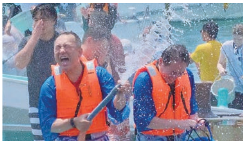
海上安全と大漁を祈願する祭りに参加