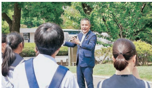
地元中学校の国会見学で挨拶