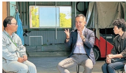
地元農業従事者との意見交換