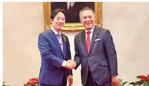
台湾の新総統・副総統就任式