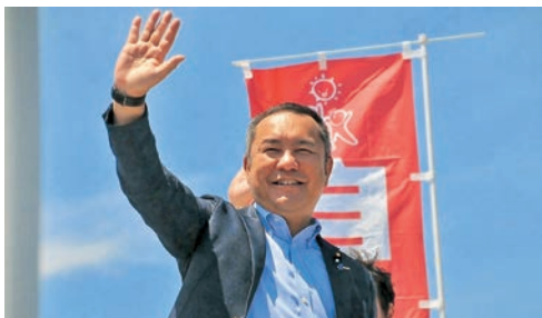
憲法改正実現街頭キャラバン